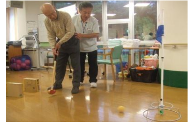
ゲートゴルフでのひとコマ

今年の梅雨は、今までになく荒れ模様となっておりませんが、皆様におかれましては、皆様にお変わりありませんでしょうか？ 『皆田のさと』でも、室内のレクが中心でしたが、工夫することでも悪天候も吹き飛ばすくらいに笑顔で包まれました。 写真はゲートボールとグラウンドゴルフをミックス