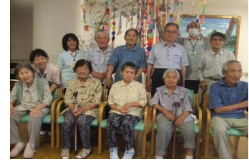
ゲートゴルフでのひとコマ

最近では『暑い夏』よりも、『熱い夏』という表現の方がピッタリではないかと思えますが、皆様いかがお過ごしでしょうか。 皆田のさとでの七夕でも、『涼しい夏』と、短冊を飾りたいところでしたが、自分や家族の願いを込めた、短冊で、きれいな七夕飾りが出来上がりました。思いきりと望みが叶うと思います。