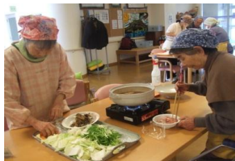
「皆田のさと」 冬のレクリエーション